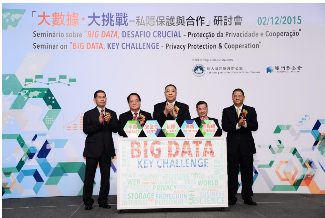
Chefe de Executivo, Chui Sai On (centro), e convidados presidiram à cerimónia de abertura do Seminário