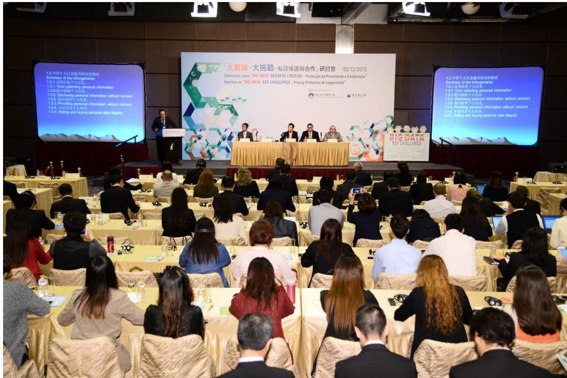
Realização do Seminário sobre “ Big Data , Desafio Crucial – Protecção da Privacidade e Cooperação” em Macau